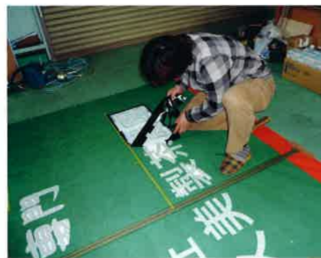
〈4〉ロゴと文字プリント